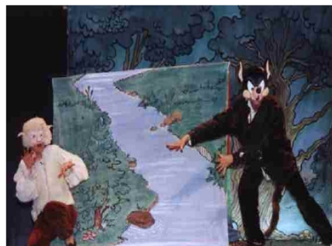
Le Loup et L'agneau