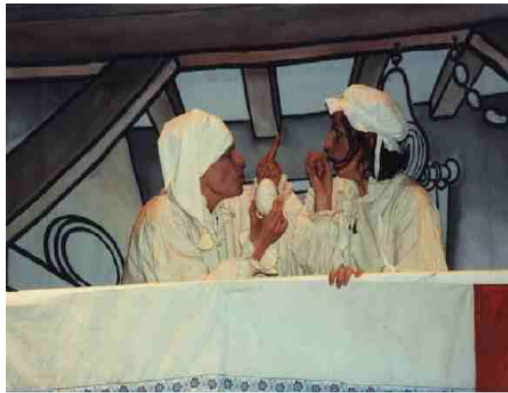
La Poule aux œufs d'or