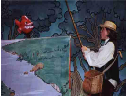
Le Petit Poisson et le Pêcheur