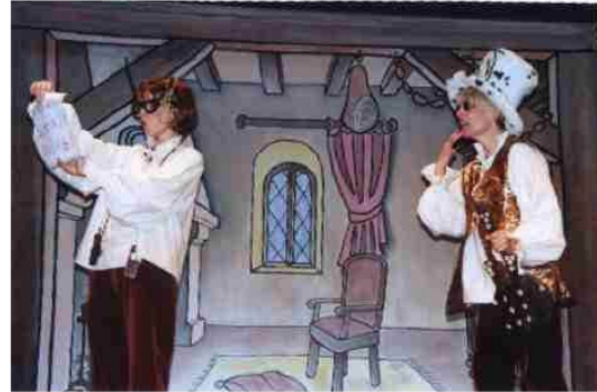
La Cigale et la Fourmi