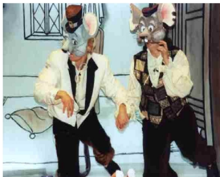
Le Rat des villes et le Rat des champs