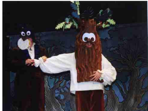
Le Corbeau et le Renard