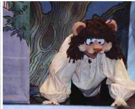
le Lion et le Rat