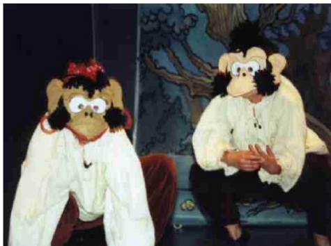
la Guenon, le Singe et la Noix