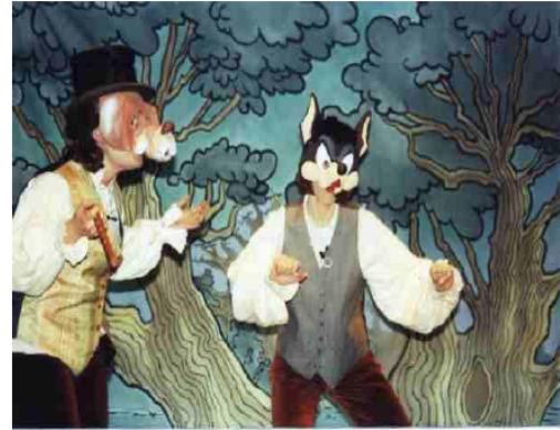
Le Loup et le Chien